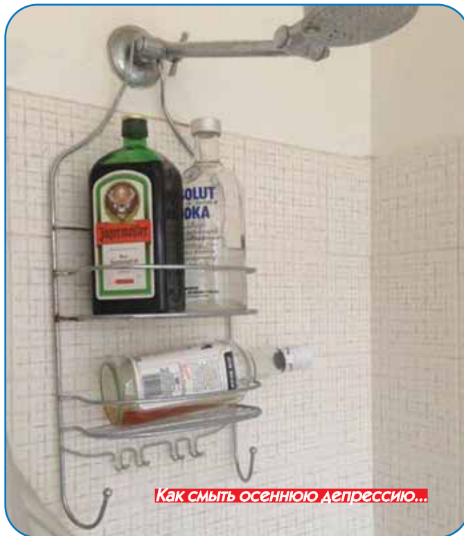
Как смыть осеннюю депрессию...

Решила я как-то купить на дачу пару пластмассовых кресел. Машины у меня тогда не было — пришлось везти их из магазина на общественном транспорте. Вставила их одно в другое и несу к автобусу, благо, ноша не тяжёлая.